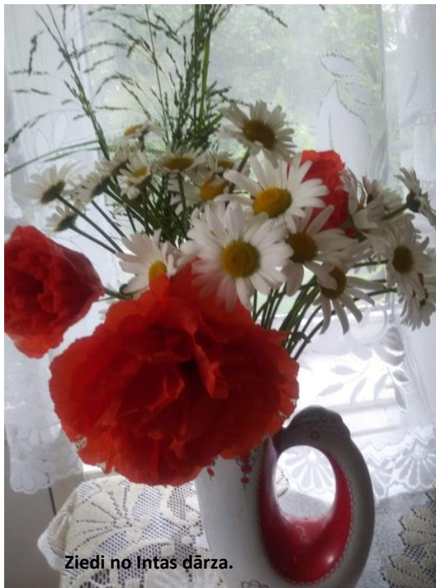
Ziedi no Intas dārza.