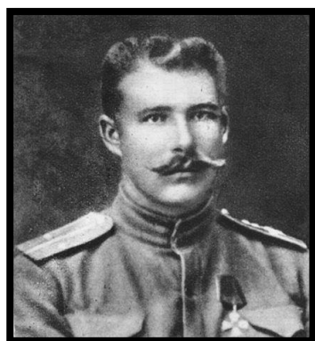
Pulkvedis Oskars Kalpaks

vēsturē. 1918.g. 18. novembrī, kad nodibinājās Latvijas Valsts, faktiskā vara vēl atradās vācu okupācijas iestāžu rokās, jaunās valsts vadībai nebija ne karaspēka, ne ieroču, ne naudas, pat ne pārtikas un maizes. Fronte vēl nesen bija vēlusies pāri mūsu zemei, un pāri par to bija sirojoši simptiem tūkstoti sveši karavīri. Vācijā bija izcēlusies revolūcija, ķeizars izsūtīts trimdā un pie varas radās citi spēki. Baltijā vācu okupācijas armija arvien vairāk sāka izirt. Maskavas lielnieki (boļševiki), izmantojot situāciju, pasludināja ar Vāciju noslēgto Brest-Litovskas miera līgumu par anulētu, uzskatot Baltijas apgabalus atkal par Krievijas sastāvdaļu. Sarkanā armija, pulkveža Jukuma Vācieša vadībā, iebruka Latvijas teritorijā un 10. decembrī ieņēma Daugavpili, 11. decembrī Pļaviņas, 12. Koknesi un 17. Valku. Visas minētās vietas vācieši atdeva praktiski bez jebkādam cīņām. Kaut gan, noslēdzot ar sabiedrotiem pamieru, Vācija bija uzņēmusies arī Latvijā aizsargāt to frontes līniju, kuru ieņēma tās karaspēks pamiera parakstīšanas brīdī.