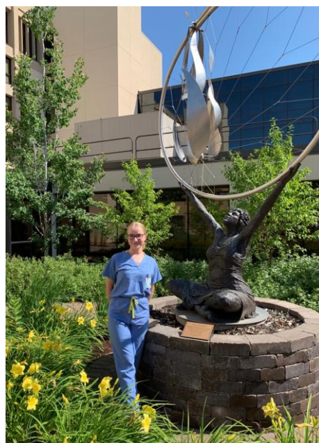
Mercy Hospital Mother Baby Center

Īpaši interesanti bija iespēja redzēt ar da Vinci robotu veiktu totālu histerektomiju.