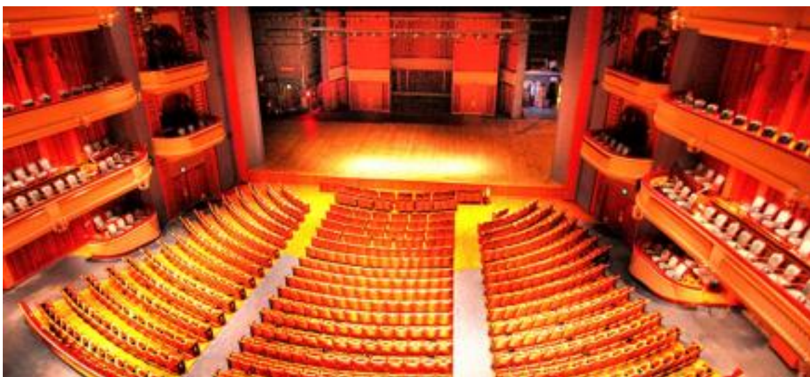
Kopkoņa koncerts notiks Ordveja centra muzikālā teātrī 3.jūlijā (Music Theater)

Netālu no katedrāles atrodas Ordvejas Centrs (Ordway Center for the Performing Arts) . Tur notiks Kamermūzikas un simfoniskās mūzikas koncerts, kā arī Viesu koņu koncerts centra koncertzālē (Concert Hall) 1.jūlijā.