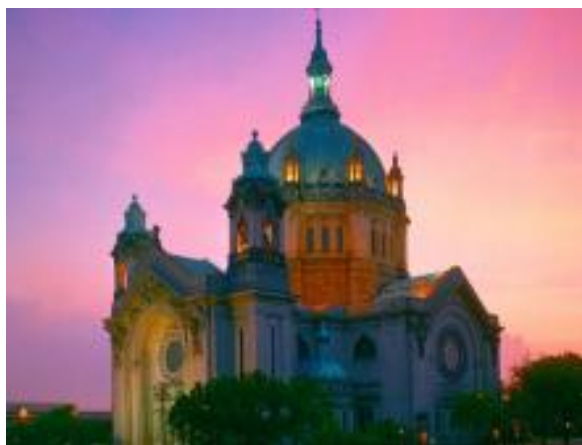
St. Paulas katedrāle (Cathedral of St. Paul), kur notiks leskaņas koncerts ar Ēriku Ešenvaldu 29. jūnijā