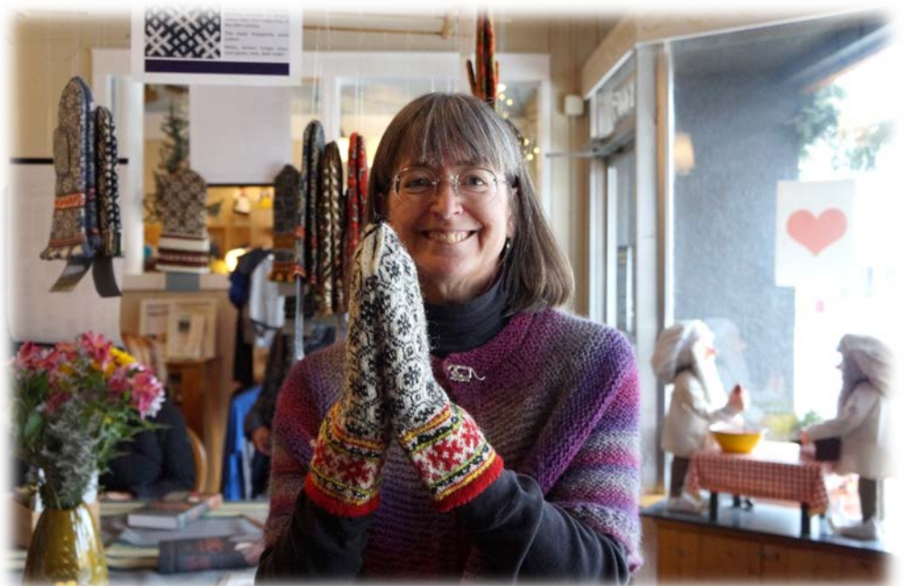
Priecīga jauno cimdu īpašniece.